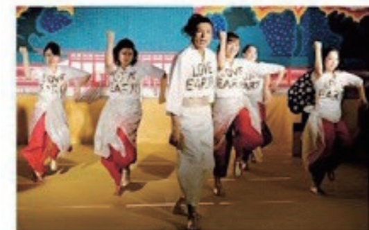
ミュージックビデオでは、平安京風建物の壁面を背景にダンサーらが曲に合わせて踊っている 京都市上京区